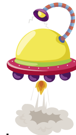
יו-אף-אוו (חפץ בלתי מזוהה)

צבעו את אותיות U (ניו גדולה) בצהוב ואת אותיות u (ניו קטנה) בכתם